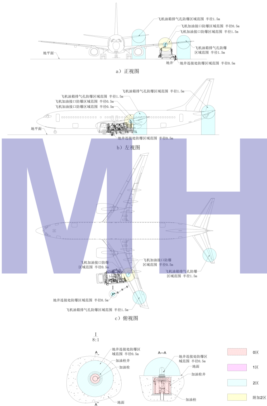
图A.2 自行式管线加油设备加油作业过程爆炸区域划分示意图

注：0区是可燃性物质以气体或蒸汽的形式与空气形成的爆炸性环境，连续存在或长时间存在或频繁出现的场所；