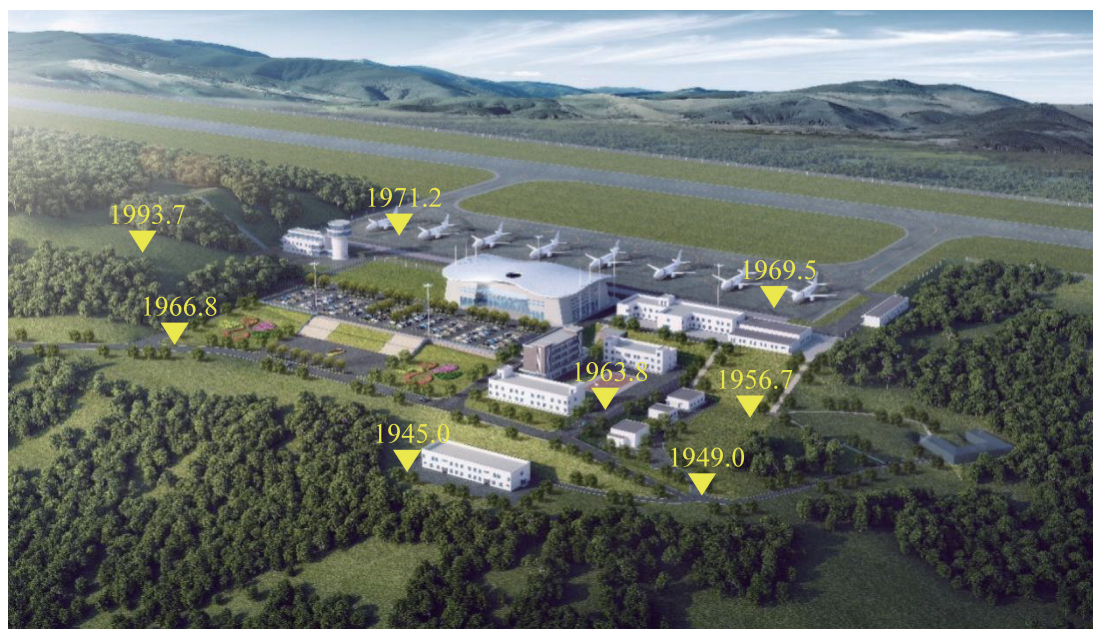
图 5.0.4 攀枝花保安营机场航站区台阶式布局示意（图中数据为标高）

【条文说明】许多高原机场位于山地，地形起伏大，航站区可借鉴山地机场依山就势、因地制宜的规划设计理念。例如攀枝花机场（如图 5.0.4 所示）、腾冲机场等，结合地形条件，分台地规划各类功能区，或结合建筑流程特点，规划半地下空间的台地建筑，以节约土方和工程投资。