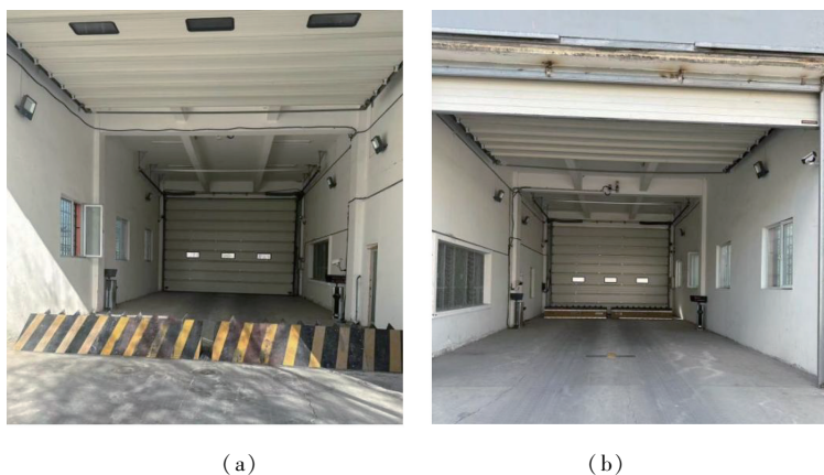
图 6.1.5 船闸式安检道口

【条文说明】船闸式道口是指四面围合、前后可开启的道口。采用这种形式，车辆安检位置由室外变为室内，避免将安检工作人员暴露于恶劣的室外环境中。如图 6.1.5 所示。