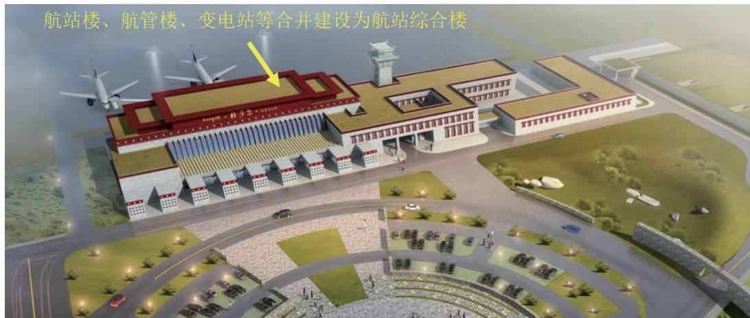
图 5.0.3-1 甘孜格萨尔机场航站区合并建设示意

【条文说明】根据甘孜格萨尔、日喀则定日等机场的经验,把功能相近或有关联的用房集中布局或者合建,有利于减少员工体能消耗,降低能耗,集约用地。如图 5.0.3 所示。