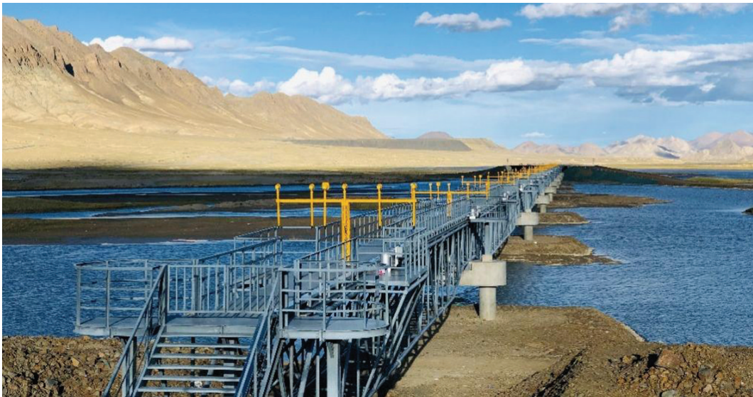
图 6.2.19 定日机场灯光桥

【条文说明】如图 6.2.19 所示，灯光桥可有效适应不良地形，能为检修人员提供检修通道，且进近灯高度适中，便于检修，大幅降低了维护工作强度和安全风险。