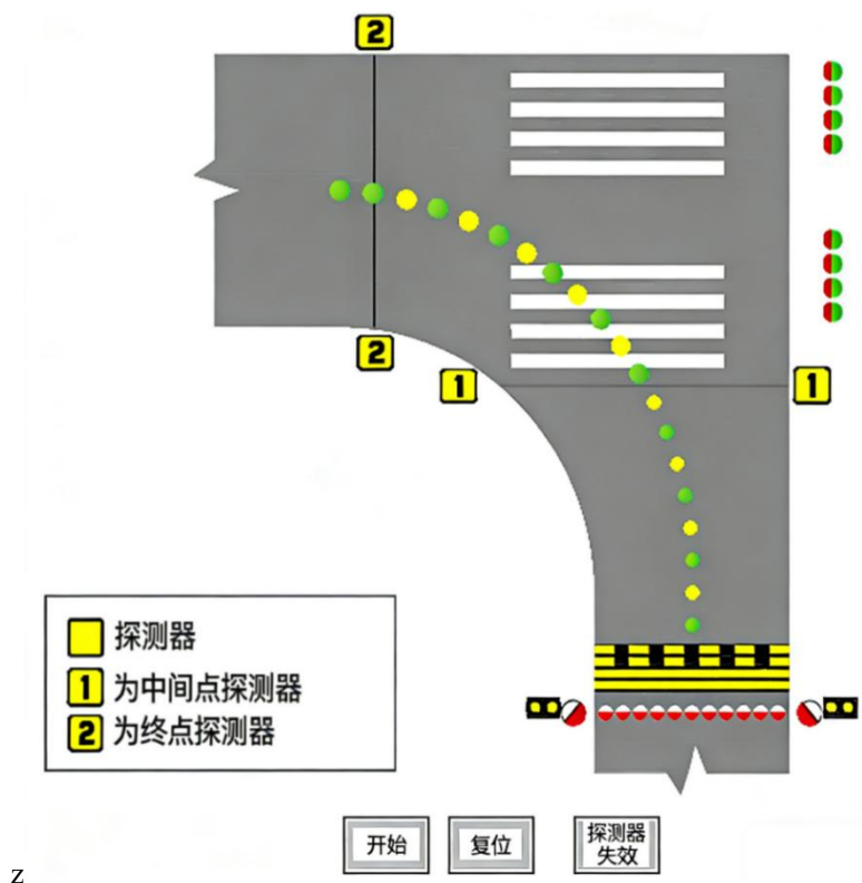
图 3 停止排灯控制页面