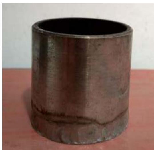
图2.2 盛装燃料的杯子