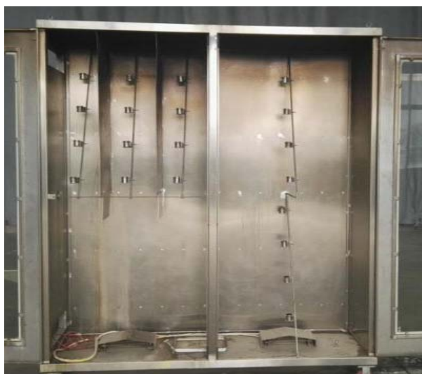
图2.3 金属杯排列方式