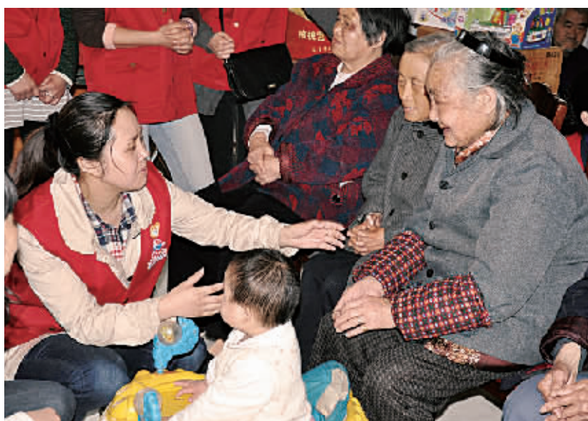
4月15日,东航四川分公司的志愿者们带着爱心捐赠品,前往成都双流县东升敬老院看望老人。志愿者们与老人们亲切聊天,还为老人们表演了节目,赢得了现场的阵阵掌声。

会议传达了上级工会重要会议精神,增补了集团第二届工会委员会委员,表彰了2009年、2010年度南航集团工会系统各类先进,签订了工会工作责任书,审议了工会财务工作报告,审议通过了《关于团结动员广大职工为实施南航“十二五”规划建功立业的决议》。职代会联席会议审议通过了南航集团公司员工奖惩暂行规定。