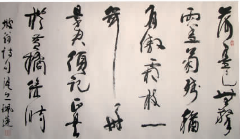
苏轼《赠刘景文》(行草) 程佩莲 民航华东管理局工会