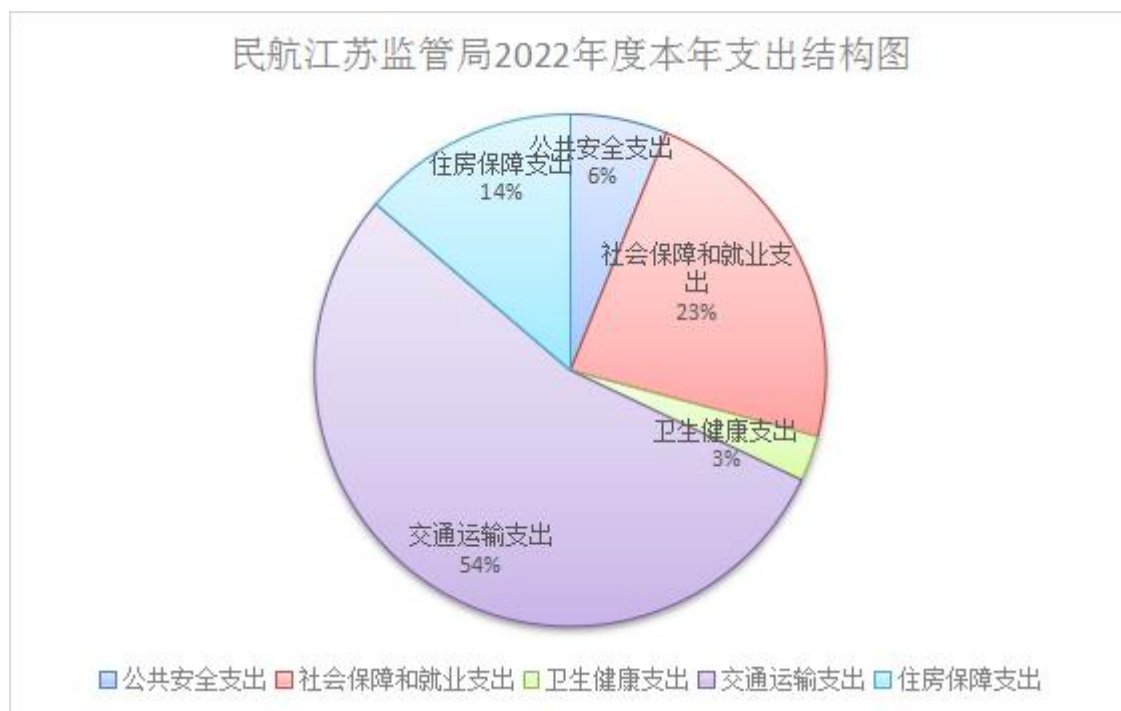
民航江苏监管局2022年度本年支出结构图