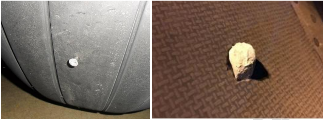
图 3 损伤部位有外来物残留