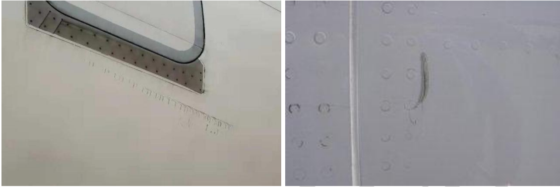
图 1 划痕