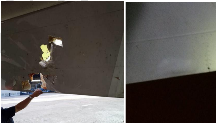
图2 机翼下表面损伤