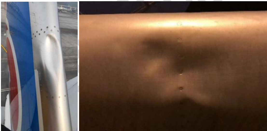
图 2 尾翼的非外来物损伤